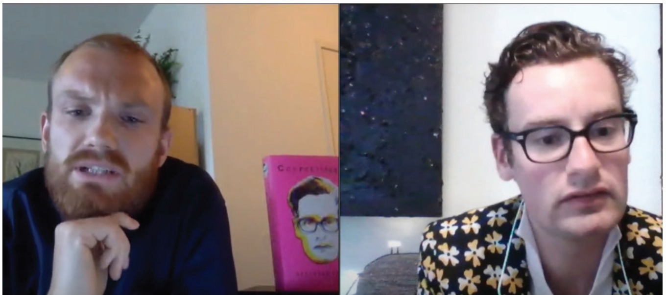
Tijdens Ontmoet Schrijvers Online konden deelnemers in gesprek met Splinter Chabot over zijn boek Confettiregen