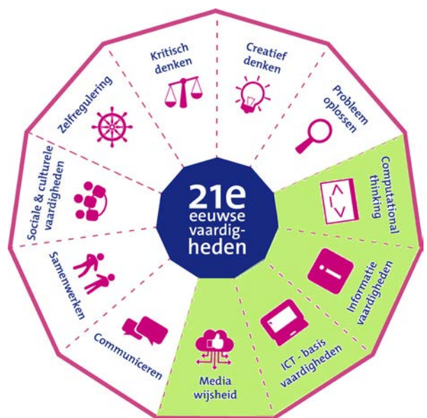
Figuur 1: Mediawijsheid is onderdeel van digitale geletterdheid. Digitale geletterdheid (groen gemarkeerd) is weer onderdeel van 21 ste -eeuwse vaardigheden.

Naast leesbevordering is ook mediawijsheid een component van de Bibliotheek op school . Deze bouwsteen wordt in de doorgaande leerlijn digitale geletterdheid van bibliotheek Gouda belegd (zie figuur 1).