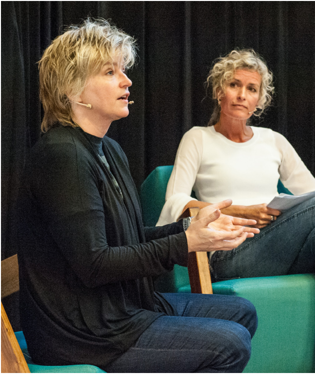
Karin Slaughter (links) werd geïnterviewd door Patricia Snel tijdens haar bezoek aan de Chocoladefabriek.

In totaal (Stadsbibliotheek plus kinderbibliotheken en uitleenpunten) kwamen opnieuw een kleine 600.000 bezoekers in aanraking met een van de vele facetten van de bibliotheek.