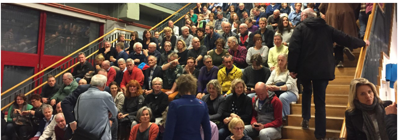
Een stampvolle Chocoladefabriek tijdens het verkiezingsdebat op 20 maart.

De bezoekersaantallen in de Stadsbibliotheek en de kinderbibliotheken in de wijken laten geen grote schommelingen zien. Op het aantal van dik boven de 500.000 bezoekers, verwelkomden we dit jaar 4.000 mensen minder in de Chocoladefabriek. Dat is deels te wijten aan (de overlast van) de verbouwing van de wc's op de begane grond en zeker ook aan de snoeihete zomer, waarmee het inspannend wekenlang rond de 32°C was.